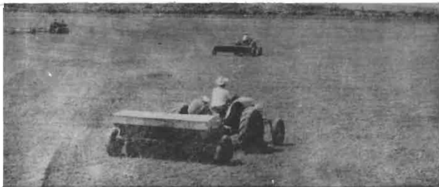
La buena preparación del suelo asegura una siembra perfecta

ña propiedad y los ejidos generalmente tienen maquinaria para la preparación adecuada del suelo, excepto para la nivelación. Todavía son muy pocos los agricultores que nivelan sus suelos en forma apropiada y por ésto el agua no se distribuye correctamente.