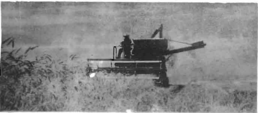
El uso de la combinada reduce el costo de la cosecha.