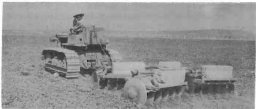
Un terreno con humedad adecuada se rastrea mejor

La densidad de siembra depende del nivel de fertilidad del suelo y de la capacidad de amacollamiento de la variedad. Cuando se usan fuertes dosis de fertilizantes pueden sembrarse de 90 a 120 Kg/Ha de semilla con poca diferencia en el rendimiento. En general, las variedades precoces tienden a amacollar menos que las variedades tardías, por lo que se sembrarán en mayores densidades. Para lograr buenos rendimientos debe haber una buena población de plantas; ésta sólo se logrará si se aplica la correcta densidad de semilla y una buena preparación del terreno. Una mala preparación del terreno requiere densidades más altas para compensar la mala nacencia. Las densidades de siembra están indicadas en el cuadro 2 para terrenos bien preparados.