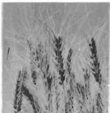
Escoja la variedad mas apropiada

En los ciclos de 1955-56 y 1956-57, la variedad Lerma Rojo sobrepasó los rendimientos de Chapingo 53 y Kentana 54 tanto en las siembras experimentales como en las comerciales que se realizaron en la región. Lerma Rojo es una variedad precoz que posee buena resistencia a los chahuixtles del tallo y lineal amarillo; también es resistente al desgrane. Es moderadamente susceptible al acame cuando se cultiva en suelos que han sido fuertemente fertilizados. Los rendimientos de Chapingo 53 y Kentana 54 fueron satisfactorios en las siembras comerciales de la región en el ciclo pasado.