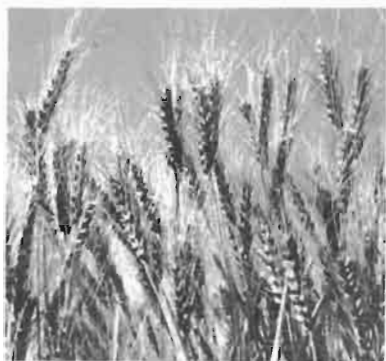
Escoja la variedad mas apropiada

Durante los últimos años, Palmito "54" se ha cultivado con éxito en algunas partes de esta zona. Su madurez es similar a la de Candeal "52".