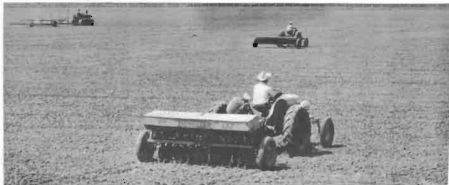
La buena preparación del suelo asegura una siembra perfecta

ña propiedad y los ejidos generalmente tienen maquinaria para la preparación adecuada del suelo, excepto para la nivelación. Todavía son muy pocos los agricultores que nivelan sus suelos en forma apropiada y por ésto el agua no se distribuye correctamente.