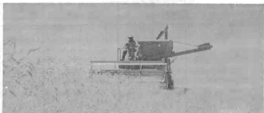
El uso de la combinada reduce el costo de la cosecha

Siembre oportunamente cada variedad como se indica en el Cuadro 2 y tendrá mayor seguridad de evitar daños por heladas y cosechar antes de que se lo impidan las lluvias.