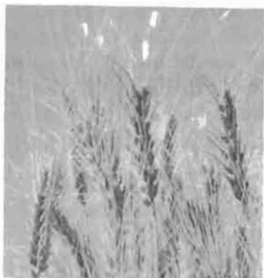
Escoja la variedad más apropiada.

La variedad Gabo 56, durante los últimos años, ha dado rendimientos satisfactorios; es resistente a las enfermedades y al acame; produce un grano blanco, duro y de excelente calidad harinera.