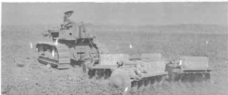
Un terreno con humedad adecuada se rastrea mejor.