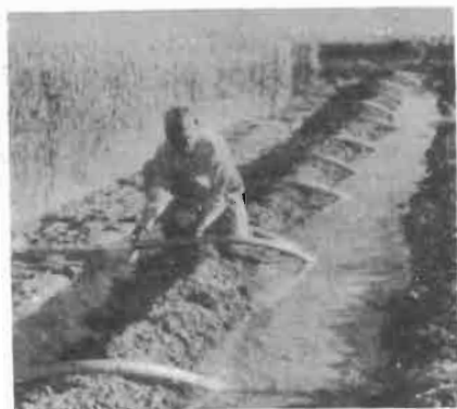
Riego por Sifón

Si desea obtener máximos rendimientos, el agricultor, deberá poner especial atención en ajustar los intervalos de riego recomendados.