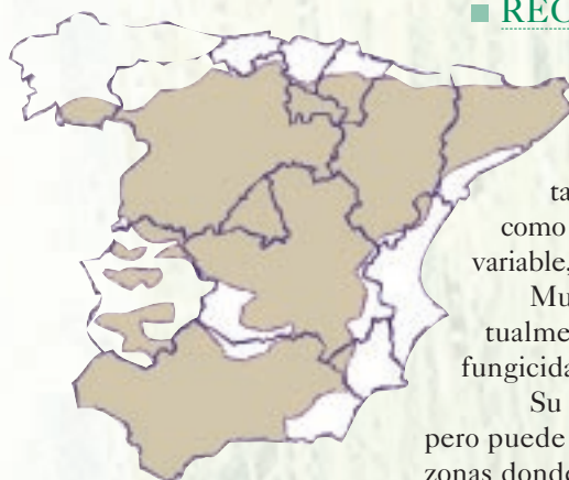
■ Zonas de Cultivo

Su ciclo de tipo alternativo, pero con un espigado tardío, en comparación con la mayoría de las variedades de primavera, permite su cultivo en siembras de Noviembre-Diciembre, tanto en las zonas de cultivo tradicional de trigos de invierno, como en las de trigos de primavera. Su comportamiento productivo es variable, dependiendo de las condiciones ambientales.