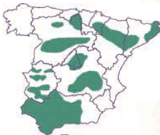
■ Zonas de Cultivo