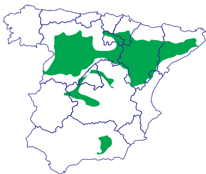
■ Zonas de mejor adaptación

Provinciale es un trigo blando harinero que destaca por su buena productividad y adaptación ambiental amplia.